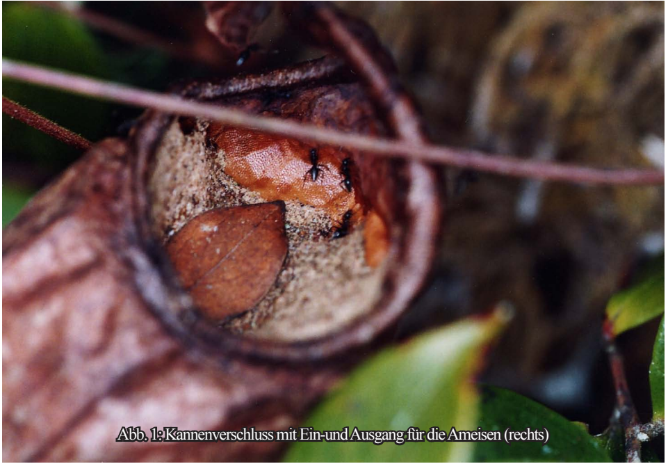
Abb. 1: Kannverschluss mit Ein- und Ausgang für die Ameisen (rechts)