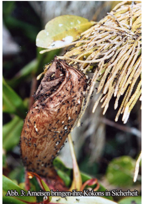
Abb. 3: Ameisen bringen ihre Kokons in Sicherheit